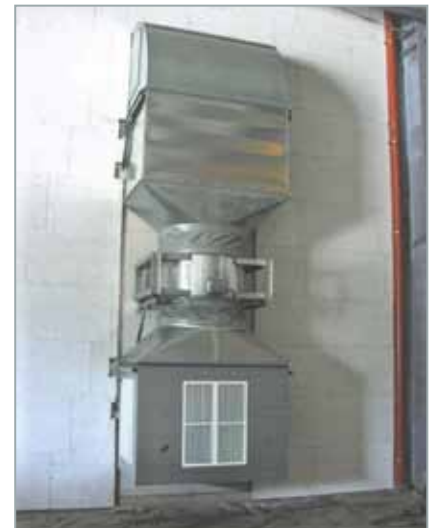
Schallauslegung Lüftung und RWA